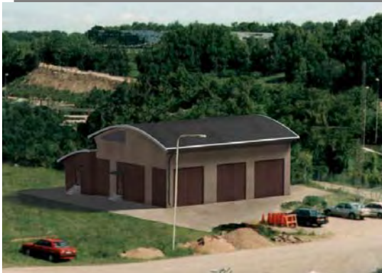
Exempel på inomhusstationer levererade av ABB

I bilaga 1 och 2 till detta kompletterande samrådsunderlag presenteras förslag på olika sträckningar från Vindkraftparken till land. Av alternativen utgör alternativ 1 huvudalternativ (bilaga 1).